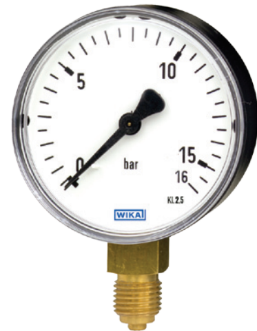
Манометр с трубкой Бурдона, модель 111.10

Температурный эффект Дополнительная температурная погрешность при изменении температуры окружающей среды от +20 °C: не более ±0.4 % диапазона измерений на 10 K